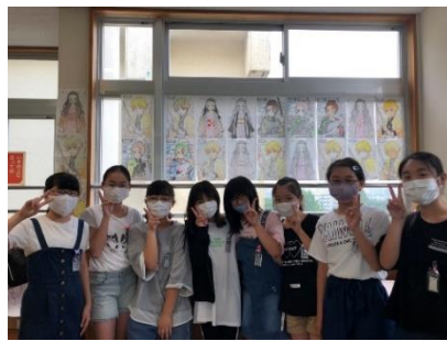
廊下展示と子ども達