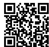
連絡メール2 保護者ログイン

学校・お子様の追加やその他登録内容を変更する場合 右記の「保護者ログイン用二次元コード」を読み取り、保護者サイトに接続します。 * その際、登録したメールアドレスとログインパスワードを入力します。 * 保護者サイト https://renraku.education.ne.jp/parent/ パスワードを忘れた場合 上記登録と同様に空メールを送信すると、パスワードの再設定ができます。 * 保護者登録しているメールアドレスがご利用できない場合は、パスワードの再設定ができません。